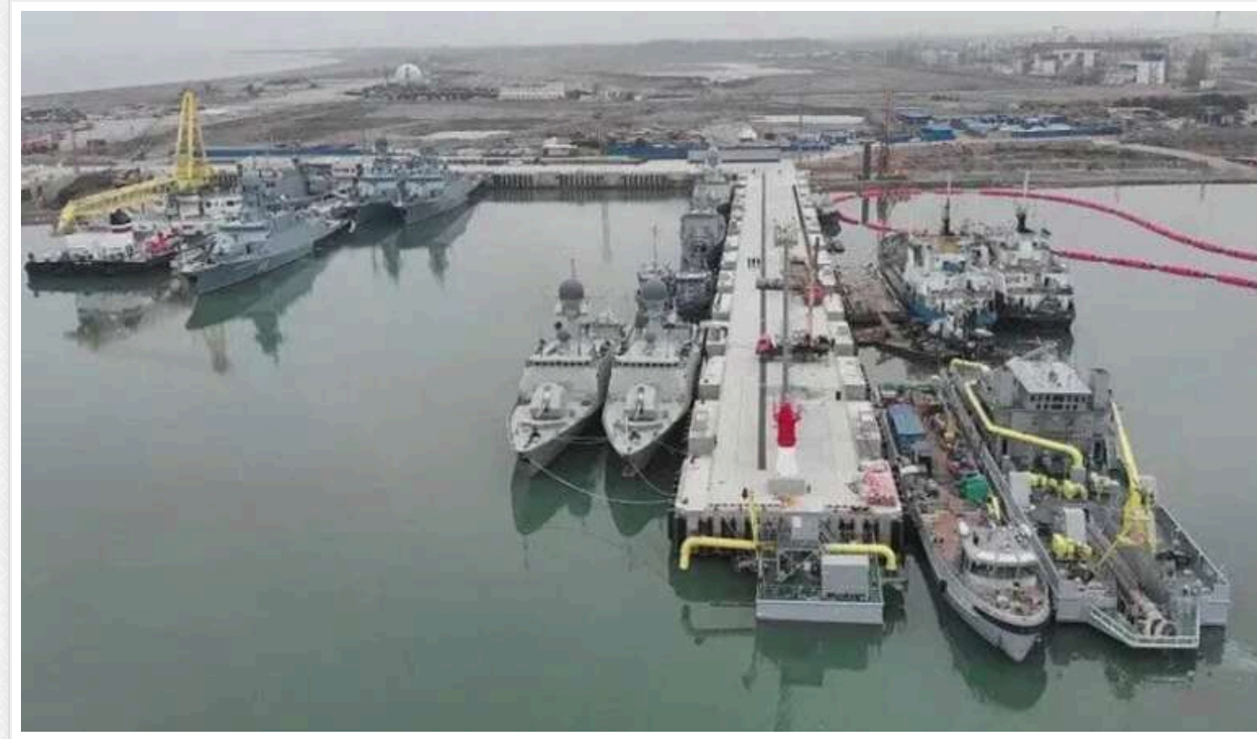
Українські безпілотники здійснили атаку на Каспійськ у Дагестані, у Махачкалі оголошено режим "Килим"

У Каспійську, що в російському Дагестані, 30 листопада пролунали вибухи. У Росії заявили про атаку українських дронів, окупанти ввели план "Килим", а аеропорт у Махачкалі призупинив роботу.