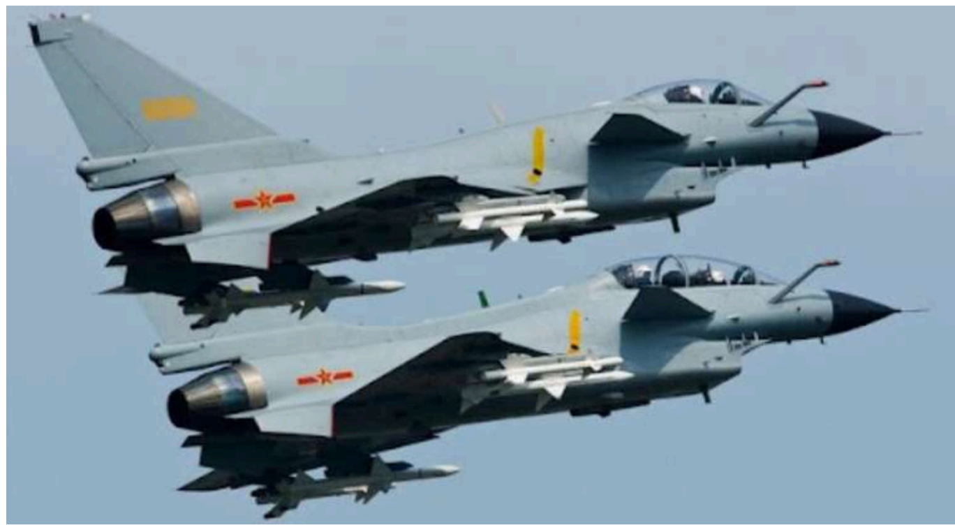
ВПС КНР та РФ провели друге за два дні спільне повітряне патрулювання

Китайські та російські військові в суботу здійснили другу фазу дев'ятого спільного стратегічного повітряного патрулювання в західній частині Тихого океану.