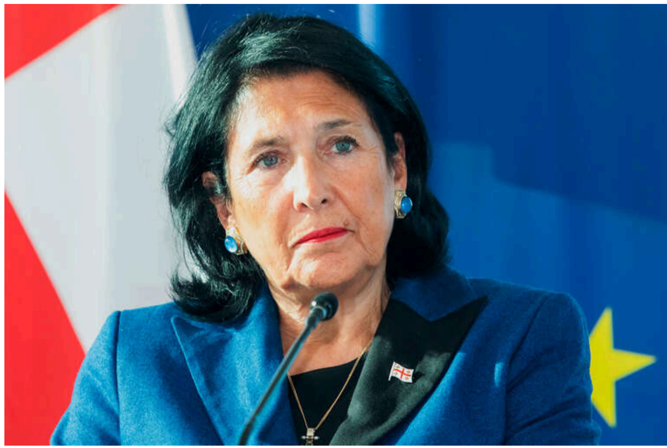
Президентка Зурабішвілі звернулася до громадян Грузії, які перебувають за кордоном

Президентка Грузії Саломе Зурабішвілі звернулася до своїх співвітчизників, які проживають у Європі та Америці, із проханням висловити свою позицію щодо подій, які відбуваються в Грузії.