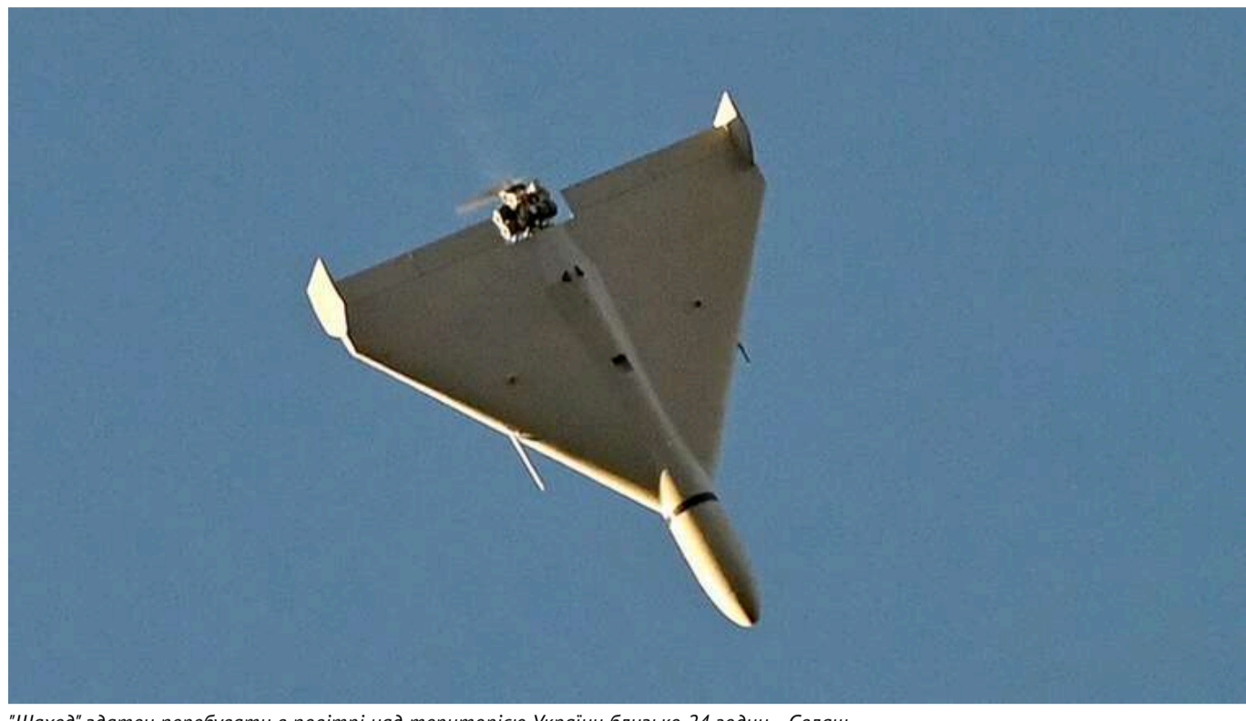
"Шахед" здатен перебувати в повітрі над територією України близько 24 годин, - Євлаш

Для досягнення цього росіяни зменшують кількість бойового навантаження.