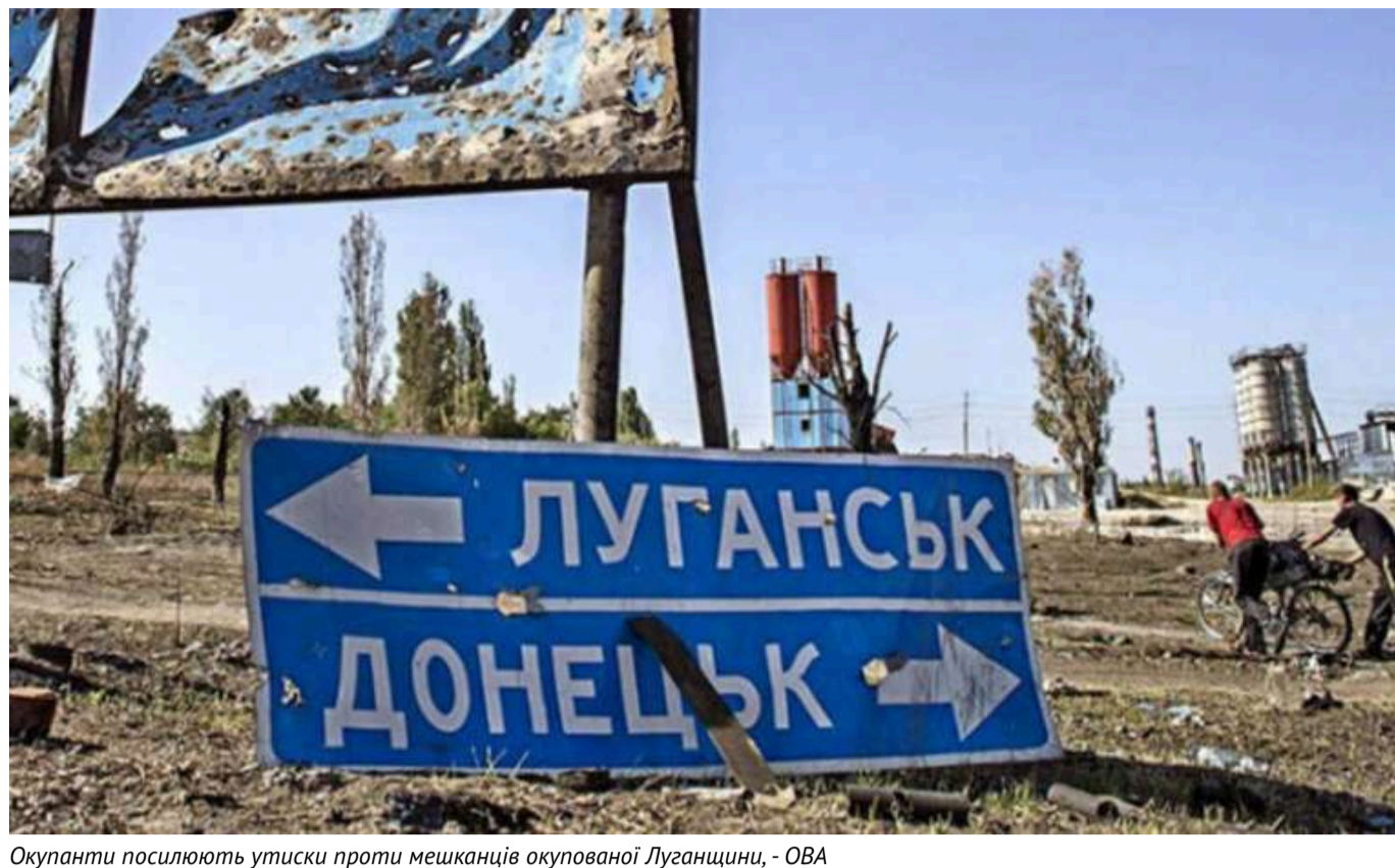
Окупанти посилюють утиски проти мешканців окупованої Луганщини, - ОВА

Силові органи Росії посилюють репресивні заходи проти населення тимчасово окупованої Луганської області.