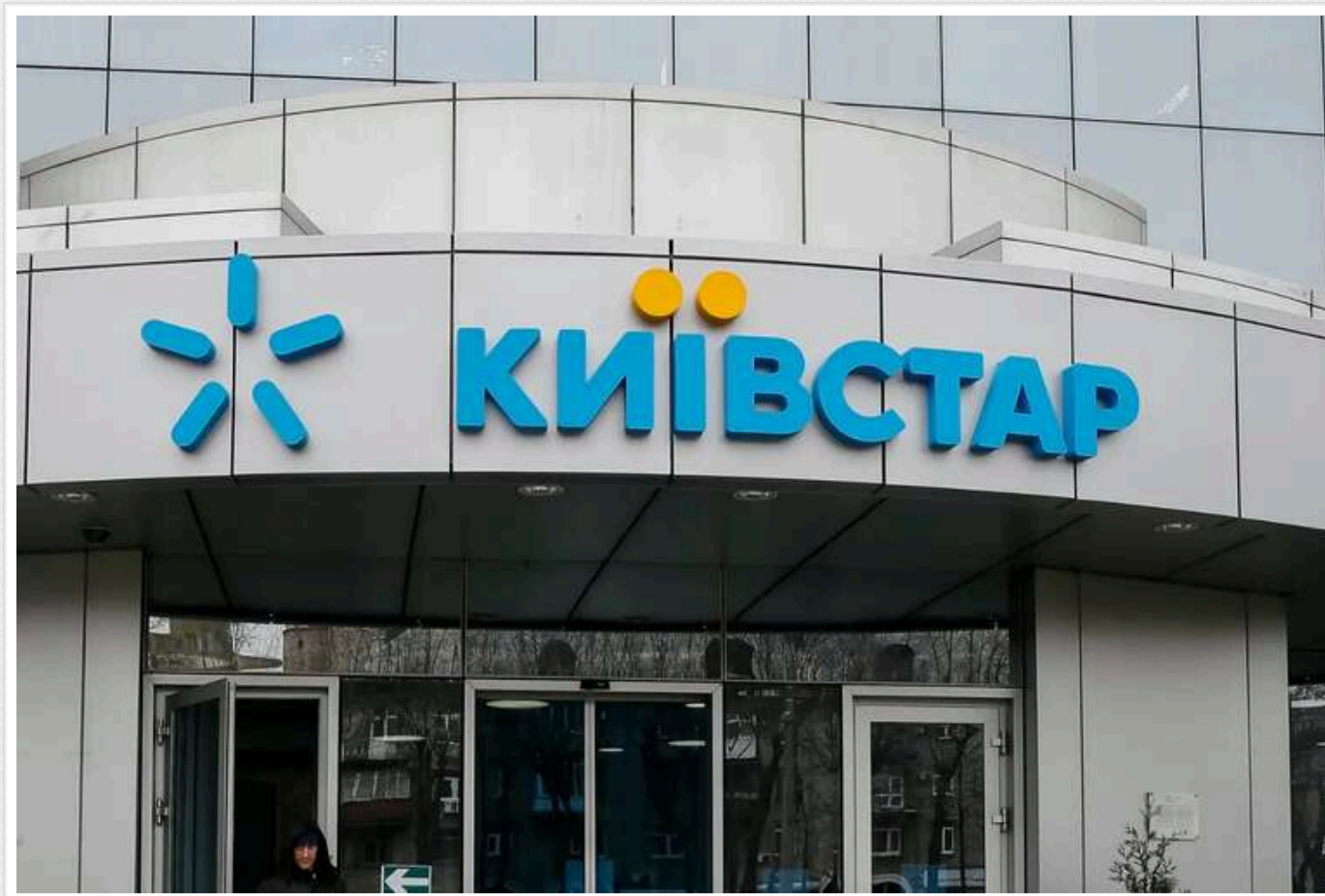
Суд зняв арешт з акцій "Київстару"

Шевченківський районний суд Києва скасував арешт 47% корпоративних прав компанії "Київстар", яка є частиною міжнародної групи Veon .