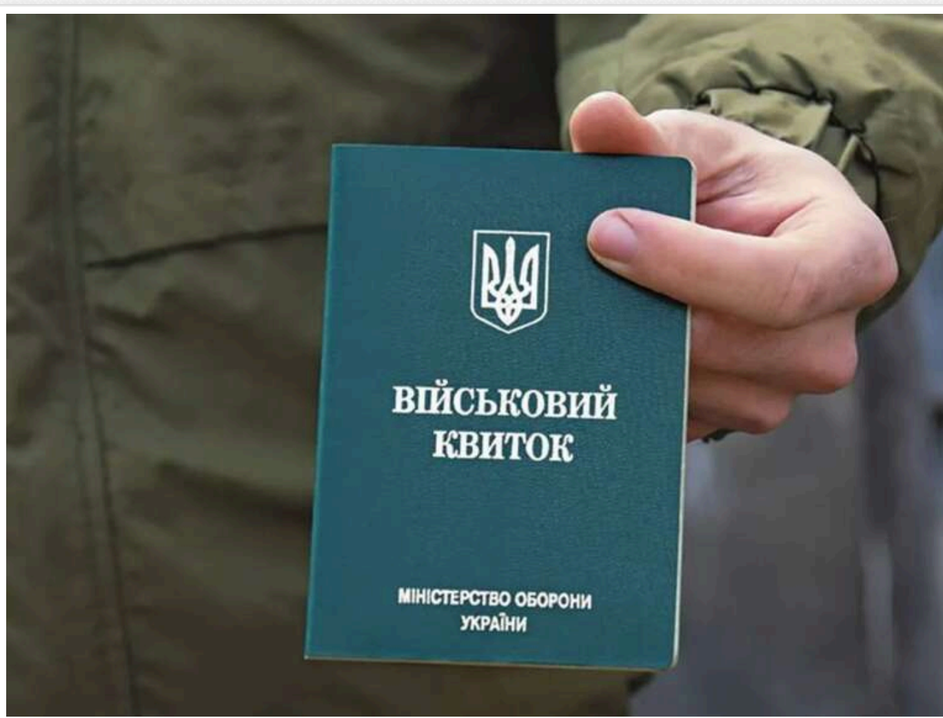
Бронювання від мобілізації: будуть враховувати зарплатний ліміт і оформлюватимуть лише в Дії

31 грудня в Україні відновлюється бронювання працівників підприємств від мобілізації – причому виключно через портал Дія. Паперових наказів про бронювання більше не буде. Оновлено також інші умови надання "броні" – тепер існують три критерії для підприємств, а також введено ліміт заробітної плати.