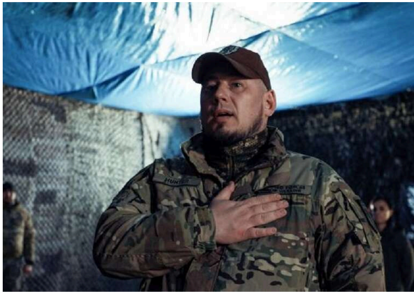
Командира 93-ї бригади призначили заступником керівника ОП

Президент України Володимир Зеленський вирішив призначити полковника Павла Палису на посаду заступника керівника Офісу президента. Він є командиром 93-ї бригади "Холодний Яр".