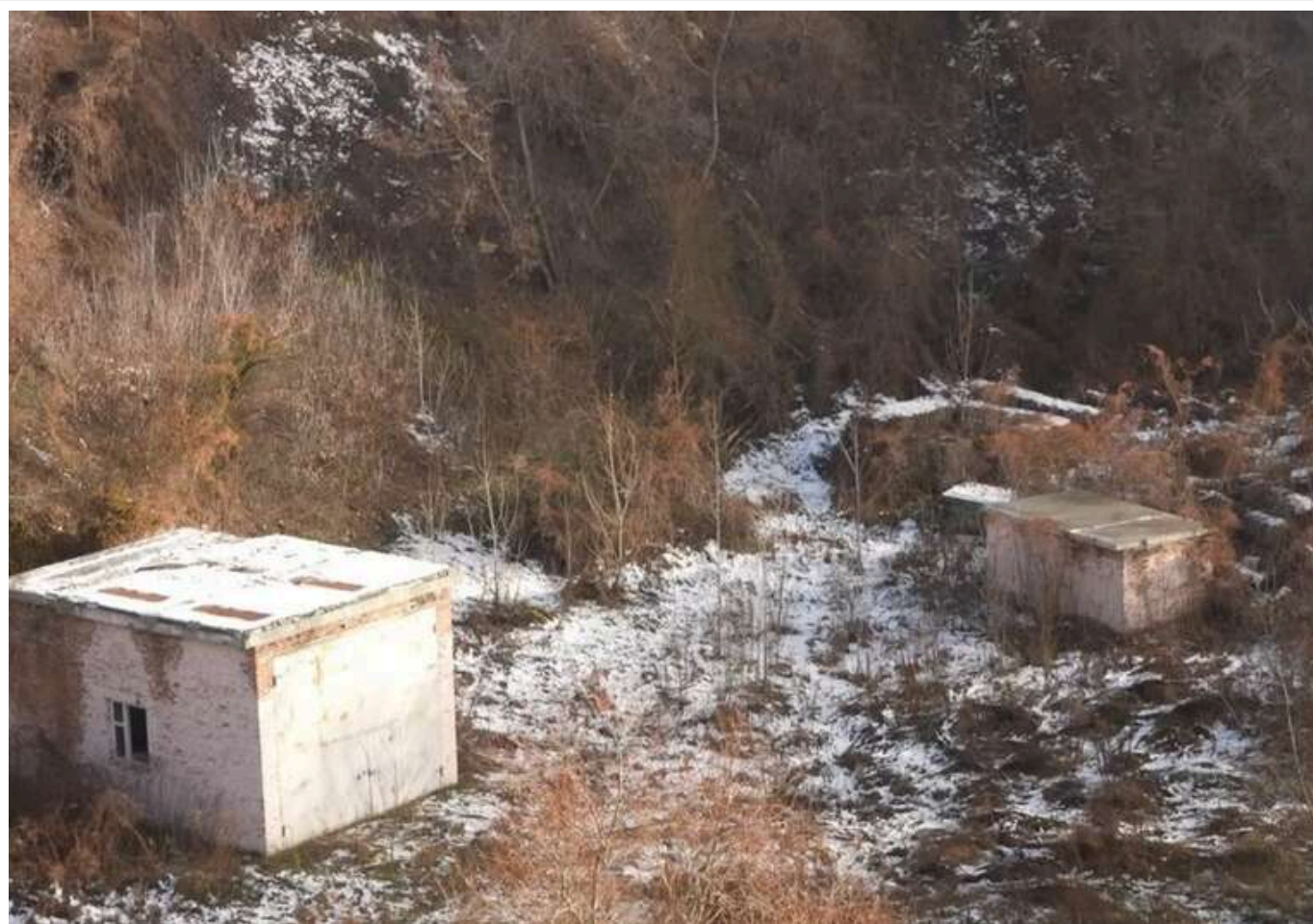
Київрада обманом віддала землю забудовнику з орбіти братів Супрунєнків

Журналісти заявили, що Київська міська рада обманом віддала пів гектара землі в Голосіївському районі столиці компанії з орбіти братів Супрунєнків, наближених до колишнього міського голови Леоніда Черновецького.