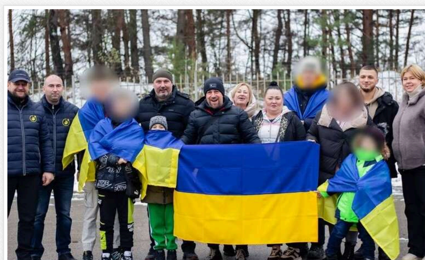
В Україну з окупації повернули ще 8 дітей

29 листопада в Україні з тимчасово окупованих територій Луганської, Донецької, Запорізької, Херсонської областей та Автономної республіки Крим вдалося повернути 8 дітей.