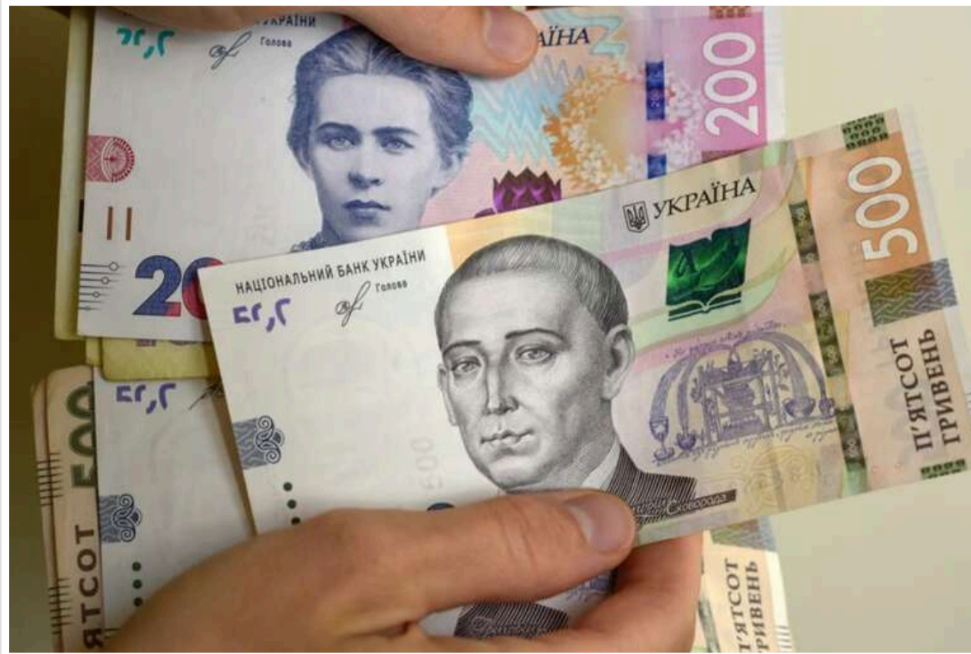
Підвищення податків в Україні: коли саме зросте військовий збір та скільки отримає Україна

Збільшення податків в Україні, зокрема військового збору з 1,5% до 5%, почнеться з 1 грудня, а не з 29 листопада 2024 року. Це підвищення принесе держбюджету України 8 млрд грн у 2024 році та 140 млрд грн у 2025-му.