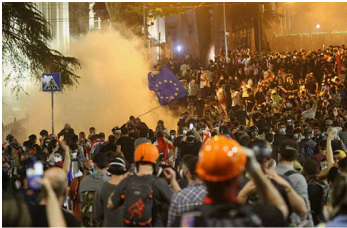
МЗС України засудило силовий розгін протесту в Тбілісі: «Згортання демократичних процесів»

Міністерство закордонних справ України засудило використання сили проти мирних демонстрантів в Тбілісі, повідомляється в заяві відомства в п'ятницю, 29 листопада.