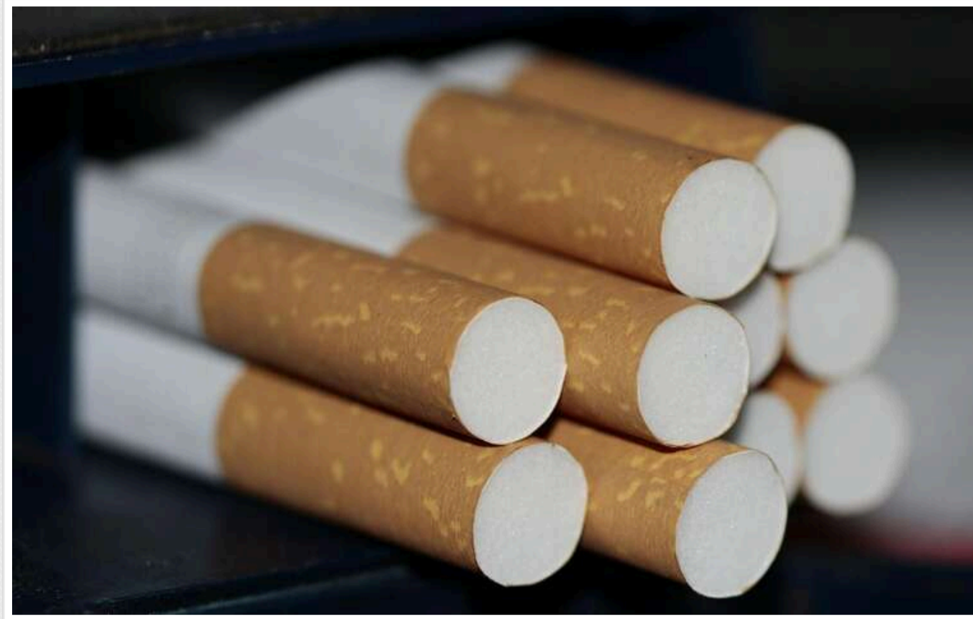
Ціна 1 пачки шгарок може зрости в середньому ще на 8 гривень

До кінця 2024 року пачка сигарет коштуватиме в середньому на 8 гривень більше, а у 2025 році ціна збільшиться ще на 10 гривень. Причина – підвищення акцизу, яке відбувається вже сьомий рік поспіль.