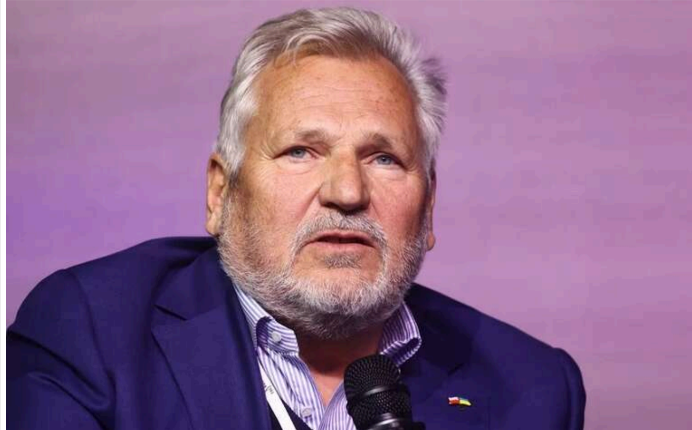
Александр Квасневський застеріг від замороження війни в Україні

Колишній президент Польщі Александр Квасневський попередив про небезпеку ідей щодо замороження війни в Україні без гарантій тривалого миру та підкреслив, що такий сценарій буде на користь Москві.