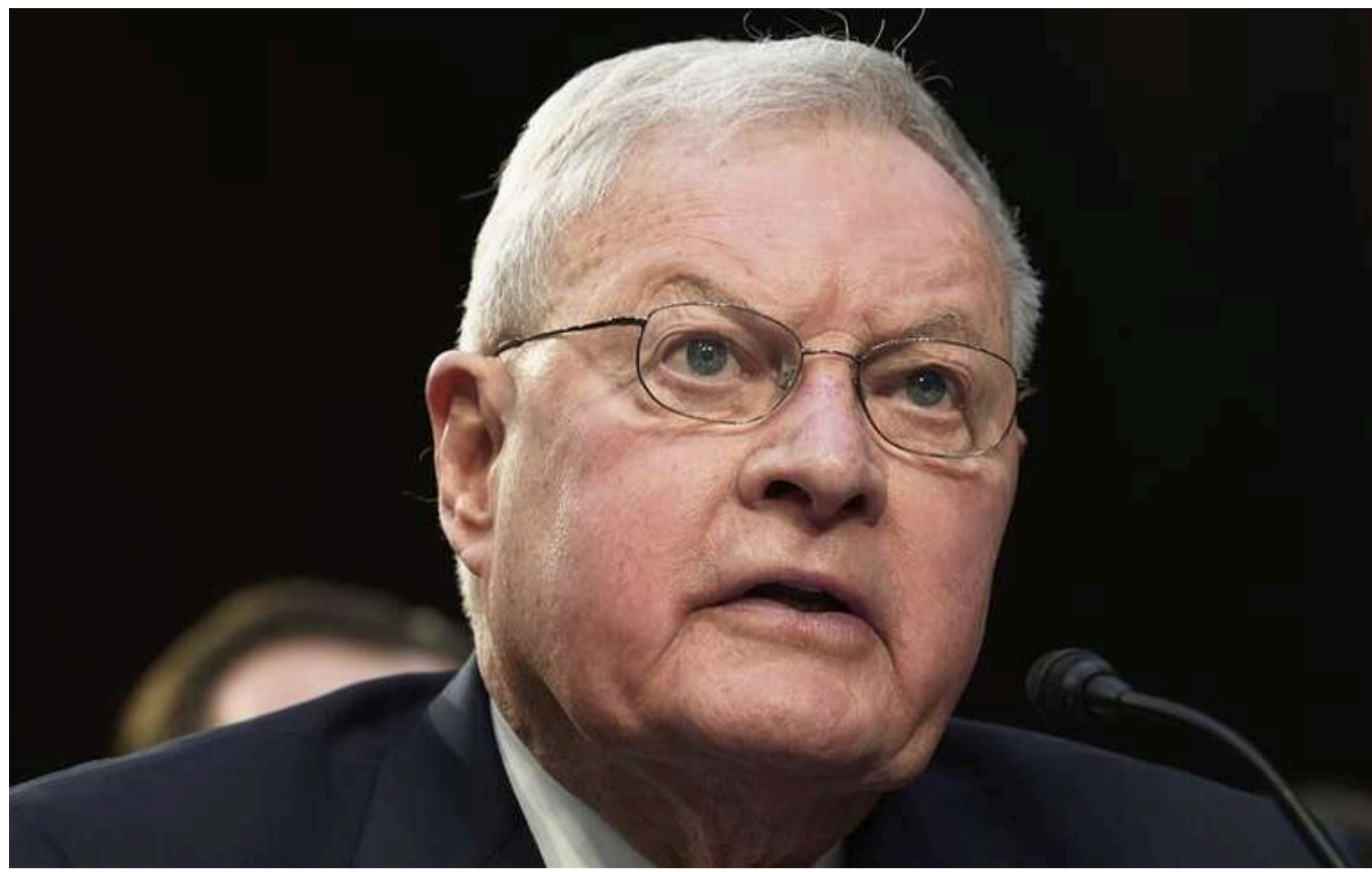
The Guardian: Келлог пропонував примусити Україну до мирних перемовин через зупинення постачання зброї

Колишній генерал-лейтенант армії США Кіт Келлог, якого Дональд Трамп призначив на посаду спецпредставника США з питань України, ще в квітні 2024 року пропонував завершити війну шляхом переговорів з Росією.