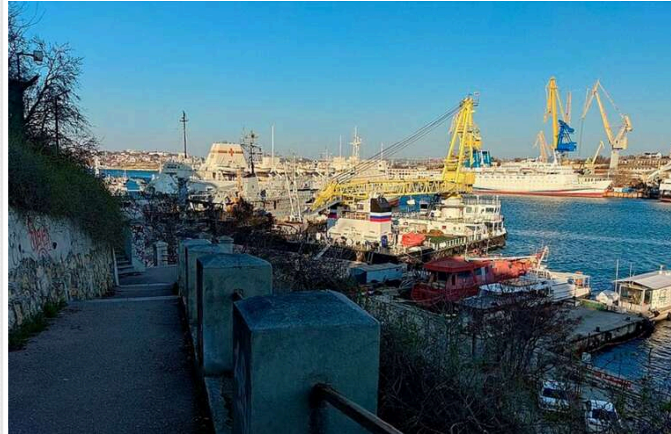
В окупованому Криму загарбники ховають кораблі в Інкермані, - соцмережі

У тимчасово окупованому Криму Чорноморський флот РФ ховає кораблі біля причалу «Вторчормету» в Інкермані.