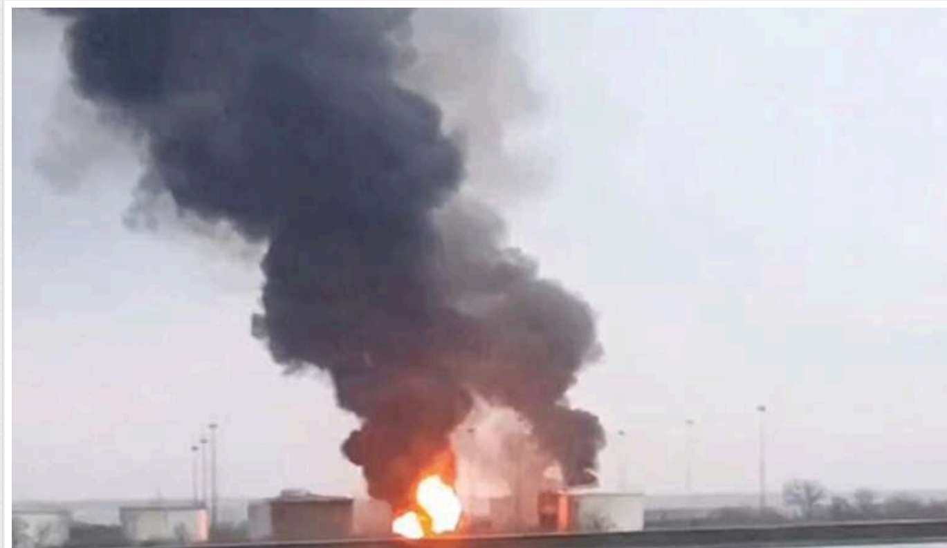
Генеральний штаб ЗСУ підтвердив атаку на нафтову базу в Ростовській області РФ

Сьогодні вночі українські військові завдали удару по нафтобазі росіян у Ростовській області, а також знищили ворожу радіолокаційну станцію ЗРК «Бук-М3» в окупованій частині Запорізької області.