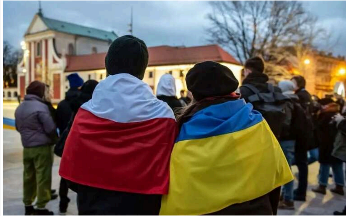
Більшість українських біженців планує покинути Польщу – лише 21% хоче залишитися на ПМП

Згідно з дослідженням Національного банку Польщі (NBP), лише 21% українських біженців і 48% довоєнних мігрантів мають намір залишитися в Польщі на постійне місце проживання. Водночас 60% опитаних біженців планують повернутися в Україну після закінчення війни.