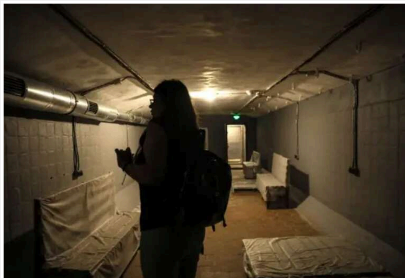
Понад 31,3 мільярда гривень на "укриття" виграли на тендерах за 1000 днів війни

Команда аналітиків YouControlMarket проаналізувала всі переможні публічні закупівлі з ключовим словом "укриття" за період з 24 лютого 2022 року по 19 листопада 2024 року в системі Prozorro. Загалом було проведено 46 088 тендерів, у яких визначено переможців, на суму понад 31,3 млрд грн.