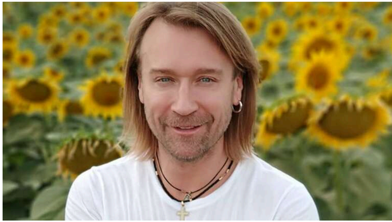
Артиста-втікача Винника рознесли за скандальне рішення

Український популярний ведучий і блогер Слава Дьомін відреагував на новину про те, що втікач Олег Винник проведе свій перший за три роки концерт у Варшаві.