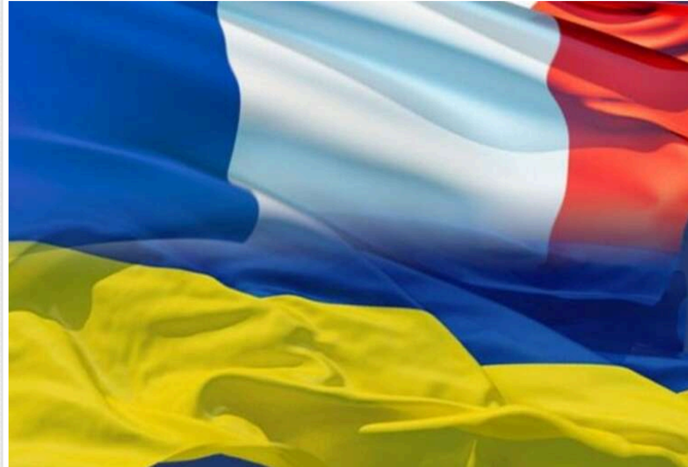
Французькі радники стурбовані можливими переговорами між Росією та США без участі України та Європи

Радники президента Франції Емманюеля Макрона висловлюють стурбованість з приводу можливості, що дипломатичні зусилля в питаннях України будуть в основному між США та Росією, залишаючи Україну та Європу поза увагою.