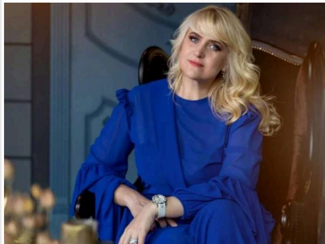
Похоронну фірму Ландар "Петро Великий" викрили в монополії: за безцінь орендує лікарняні приміщення і нав'язує послуги родичам померлих

Приватна компанія «Петро Великий», яка надає ритуальні послуги в Києві, за підтримки чиновників КМДА та керівників міських лікарень змогла зайняти фактично монопольне становище на ринку та встановлює надмірно високі ціни на послуги за поховання.