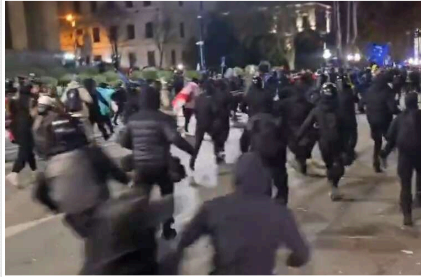
Грузинський спецназ під час розгону в Тбілісі нападав на журналістів

Під час розгону акції протесту в Тбілісі в ніч на п'ятницю силовики застосовували силу до журналістів, постраждали півтора десятка представників ЗМІ.