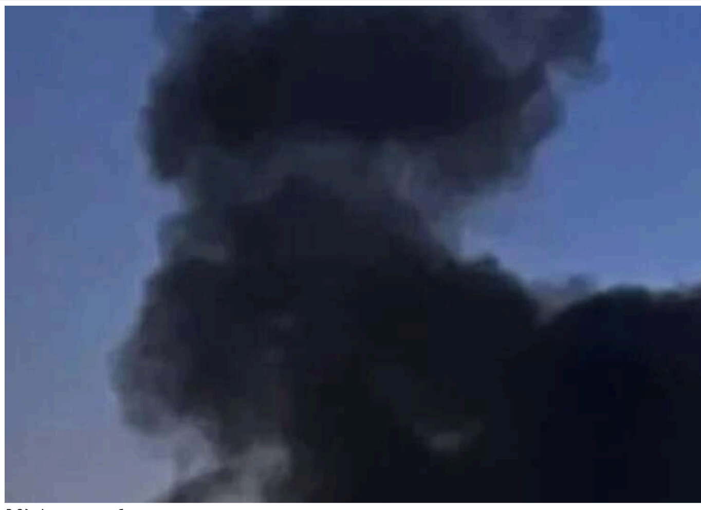
В Одесі пролунали вибухи