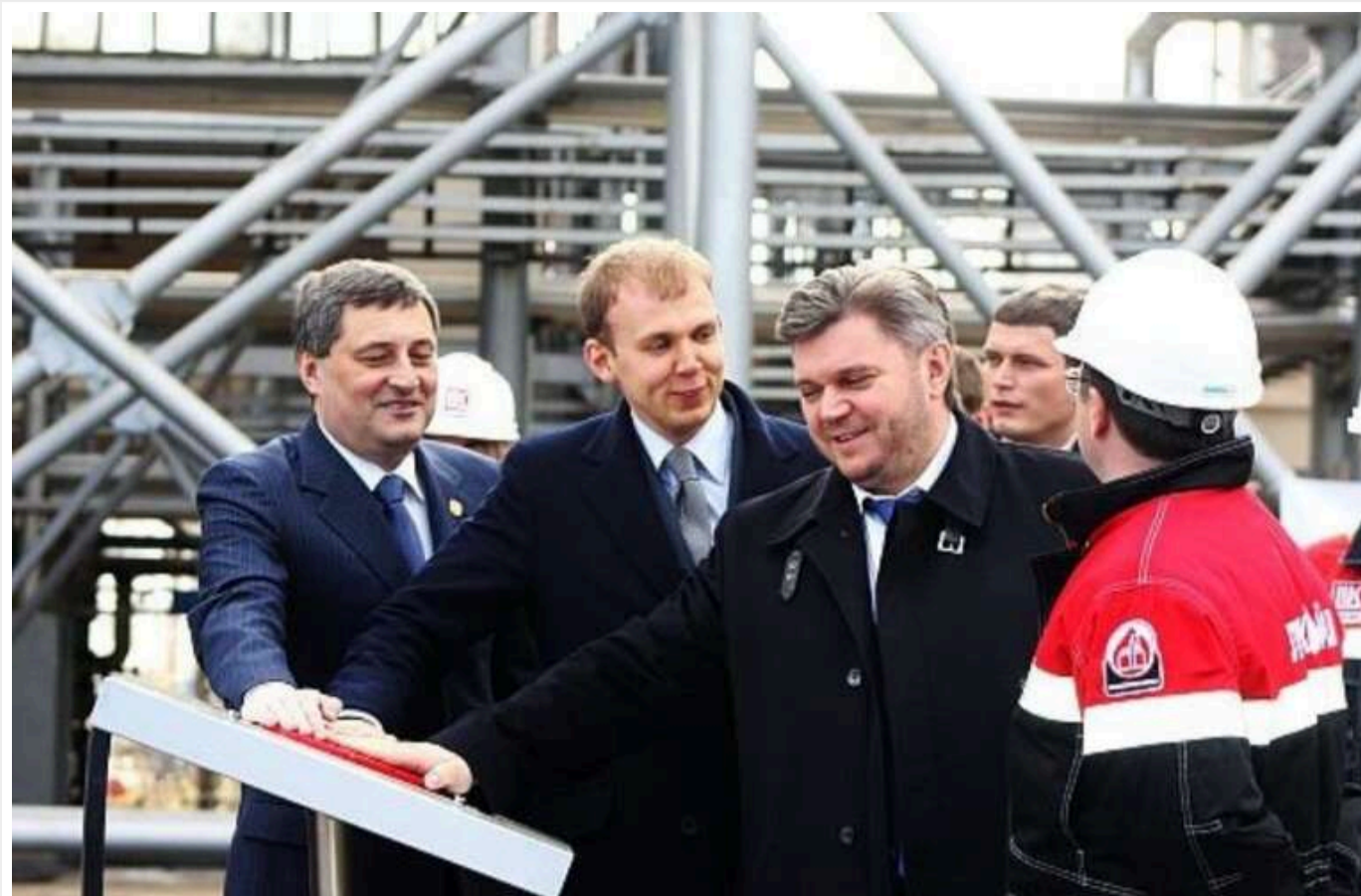
Київський суд зняв арешт із майна родичів колишнього міністра Ставицького

Вишгородський районний суд Київської області скасував арешт майна родичів колишнього міністра енергетики Едуарда Ставицького.