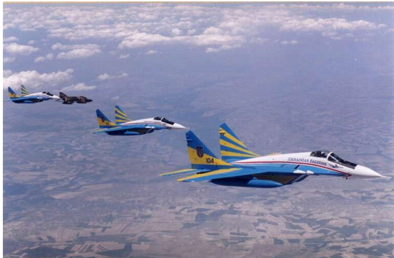
День, коли продали безпеку країни за 11 мільйонів доларів: 18 років тому завершилася ліквідація стратегічної авіації ПС України

Було знищено 60 бомбардувальників, зокрема 10 надпотужних Ту-160, а також сотні ракет.