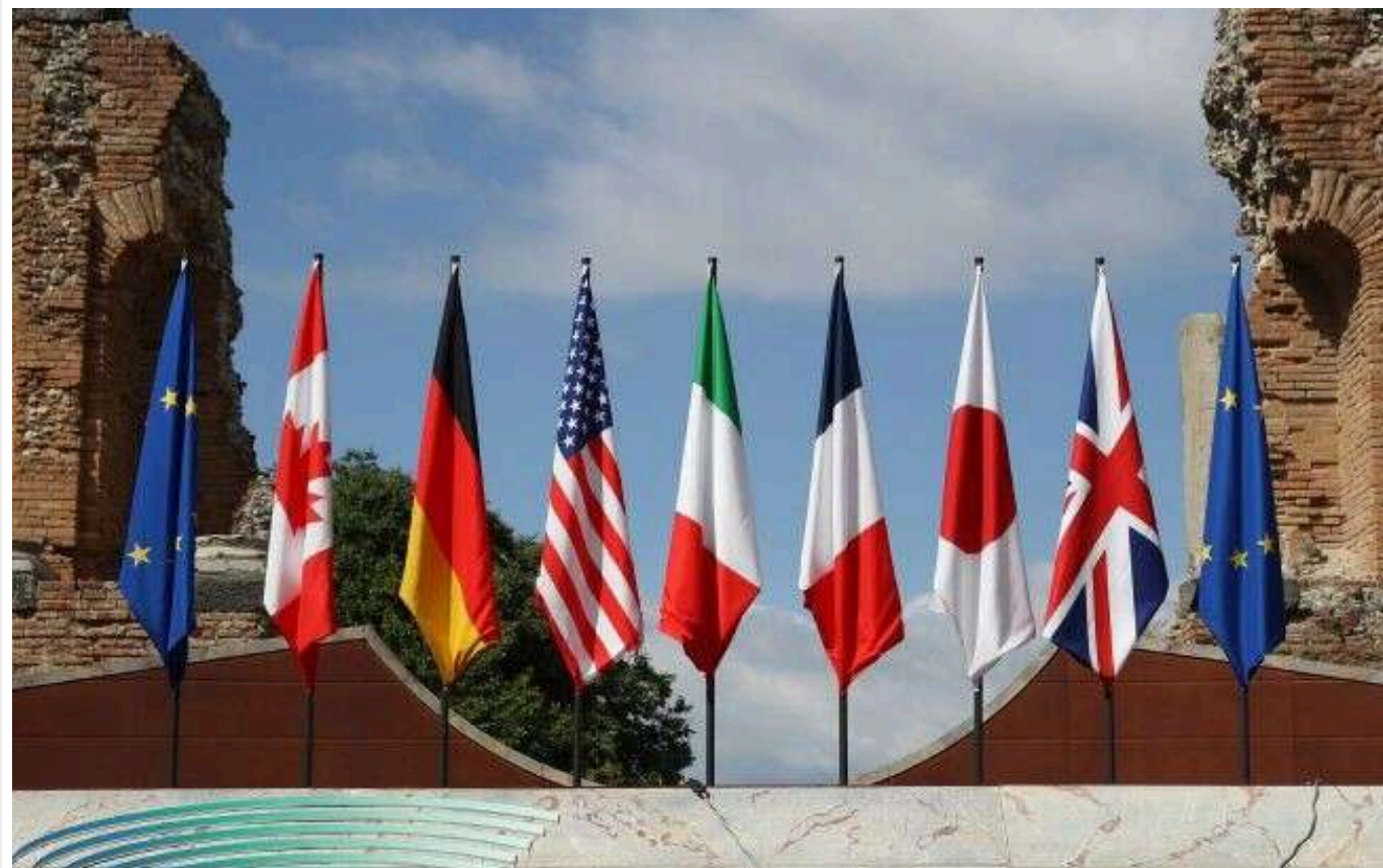
У G7 «висловлюють стурбованість» через ескалацію війни в Україні

Країни G7 «висловили занепокоєння» через загострення конфлікту в Україні й оголосили про намір розпочати переказ Києву коштів за кредитом у розмірі 50 мільярдів вже до кінця року.