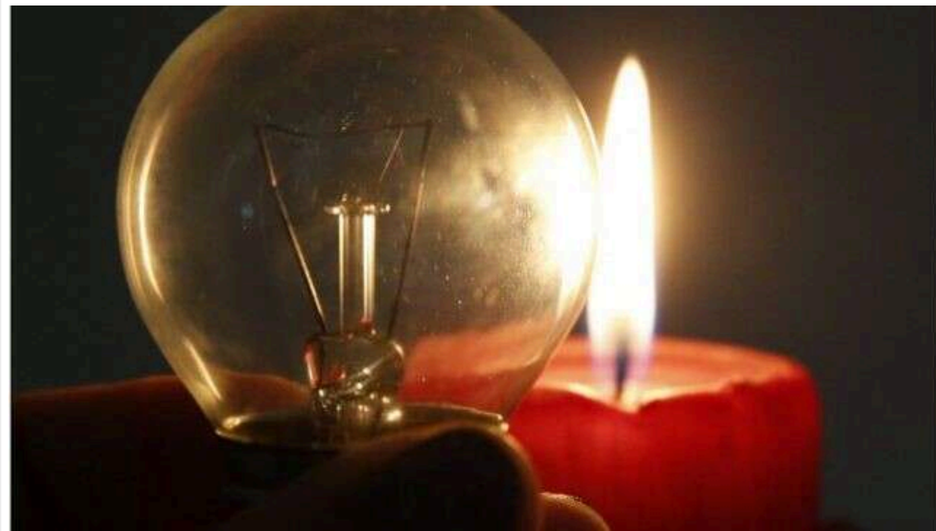
На захоплених територіях Запорізької та Херсонської областей масово відключають світло

У районах Запорізької та Херсонської областей, які перебувають під контролем Росії, відбуваються масові відключення електроенергії.