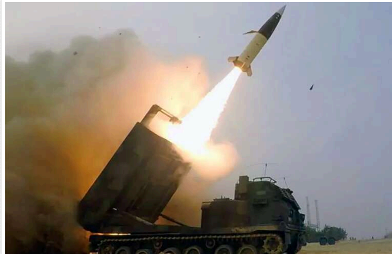
ППО не змогла збити ракети АТАСМС, що атакували аеродром у Курську: з'явилося відео

Система протиповітряної оборони Росії С-400 не змогла вразити балістичні ракети АТАСМС, які завдали удару по російському аеродрому «Курськ-Східний».