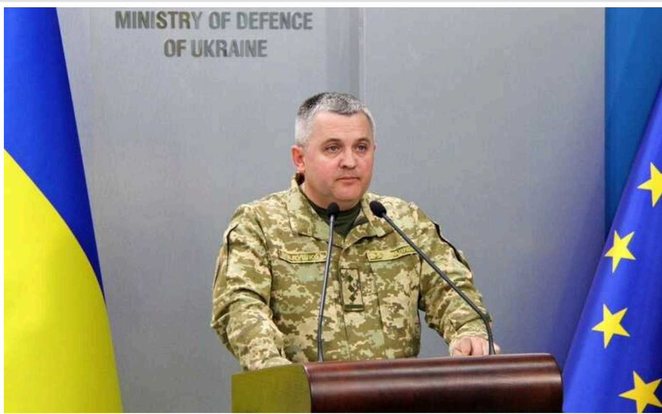
Колишнього начальника Головного квартирно-експлуатаційного управління ЗСУ Олега Галушка виправдали від корупції

Вищий антикорупційний суд визнав невинуватим колишнього начальника Головного квартирно-експлуатаційного управління Збройних сил України Олега Галушка та виправдав його від звинувачень у розтраті 21,49 млн гривень.