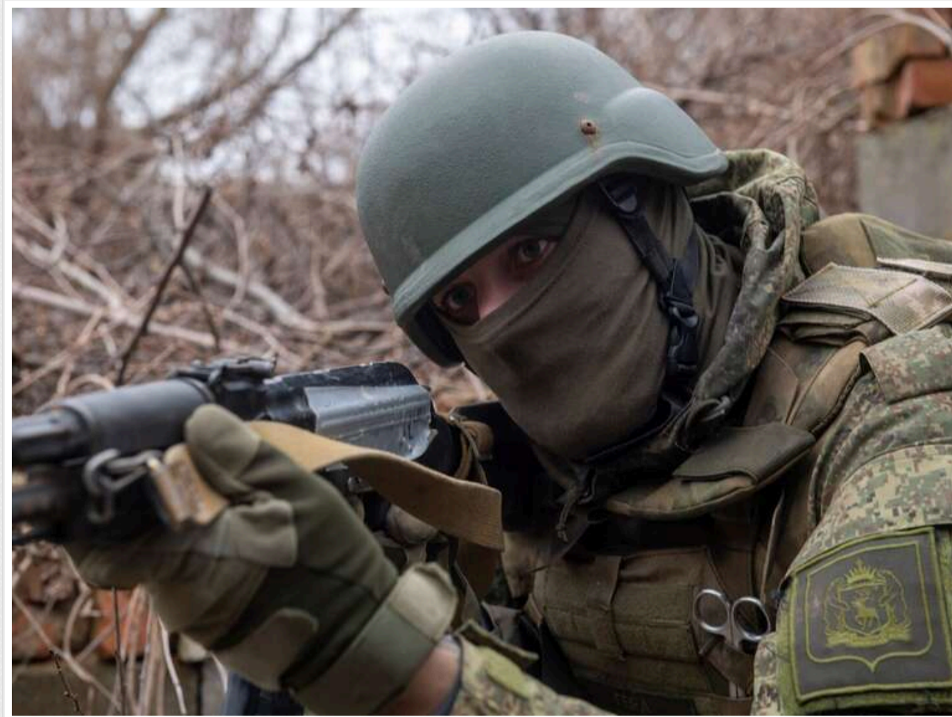
В ISW розповіли, скільки часу знадобиться ЗС РФ, щоб за нинішнього темпу наступу захопити всю Донецьку область

Росія не відмовилася від намірів окупувати більше українських територій, тому відкидає можливість йти на компроміс і почати реальні переговори. Серед пріоритетів – повна окупація Донеччини, понад третину якої контролює Україна.