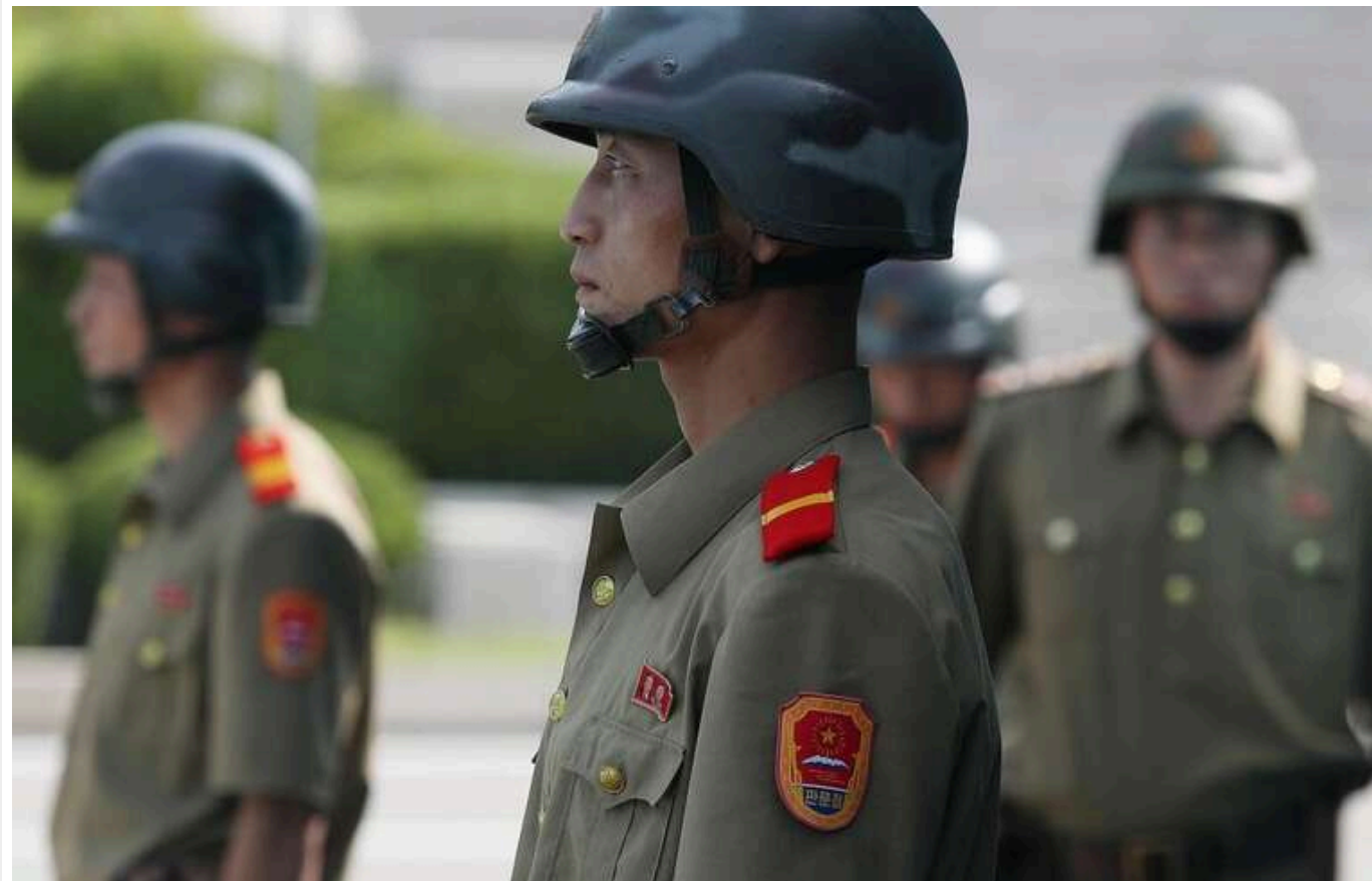
Financial Times: ЗСУ вже поранили одного генерала та вбили кількох офіцерів армії КНДР

У результаті ракетного удару по санаторію в містечку Мар'яно Курської області 20 листопада був поранений північнокорейський генерал, а кілька офіцерів армії КНДР загинули.