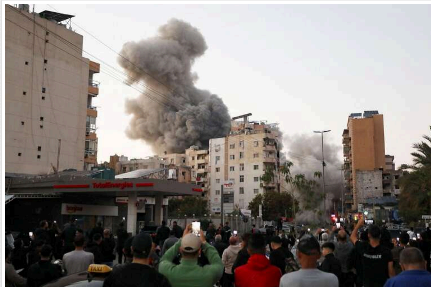
Кабінет міністрів Ізраїлю схвалив припинення вогню в Лівані

Уряд Ізраїлю схвалив перемир'я в Лівані, яке набуде чинності 27 листопада о 10:00 ранку за місцевим часом.