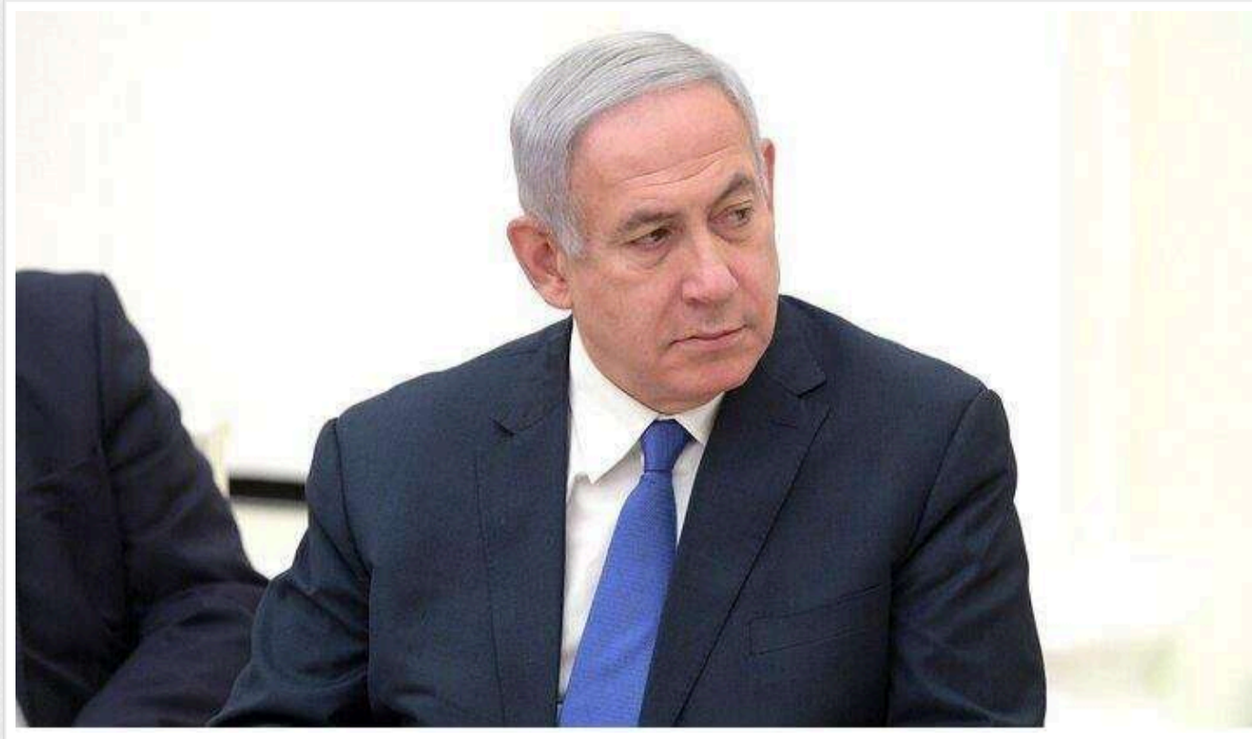
Нетаньягу вніс на розгляд угоду про перемир'я з «Хезболлою»

Нетаньягу оголосив, що представив план припинення вогню в Лівані.