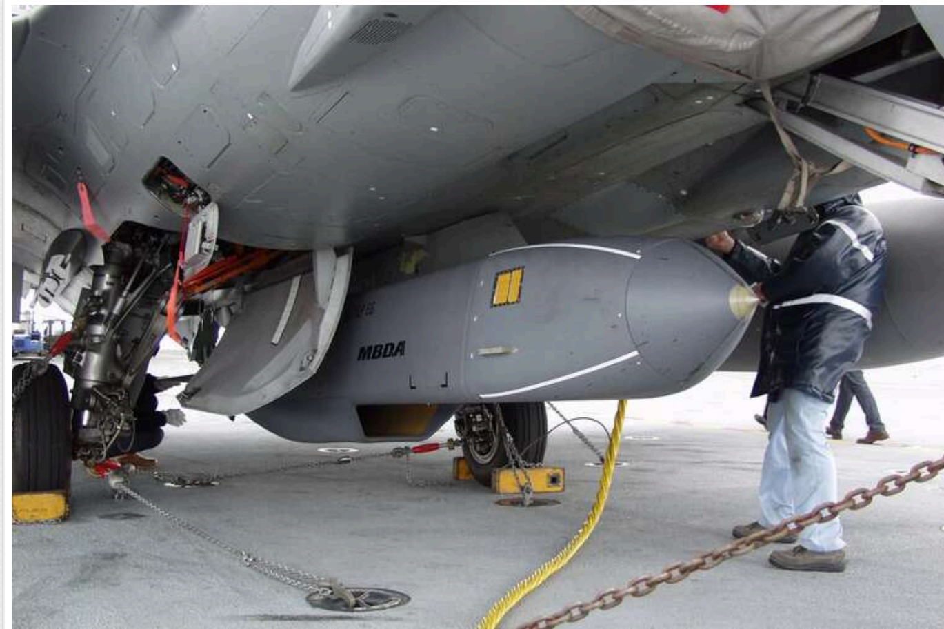
У Defense Express підрахували, скільки ракет Storm Shadow мають Британія, Франція та інші країни

Україна регулярно отримує від країн-партнерів крилаті ракети Storm Shadow/SCALP. Однак точна кількість переданих ракет та скільки їх залишилося у партнерів залишається в секреті.