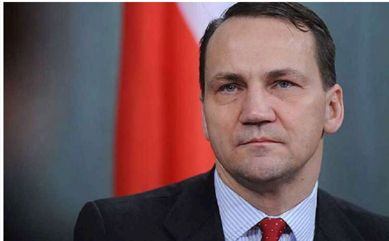
Україна дозволить Польщі ексгумувати тіла жертв Волинської трагедії

Україна підтвердила, що перешкоди для проведення пошукових і ексгумаційних робіт тіл жертв Волинської трагедії на нашій території відсутні.