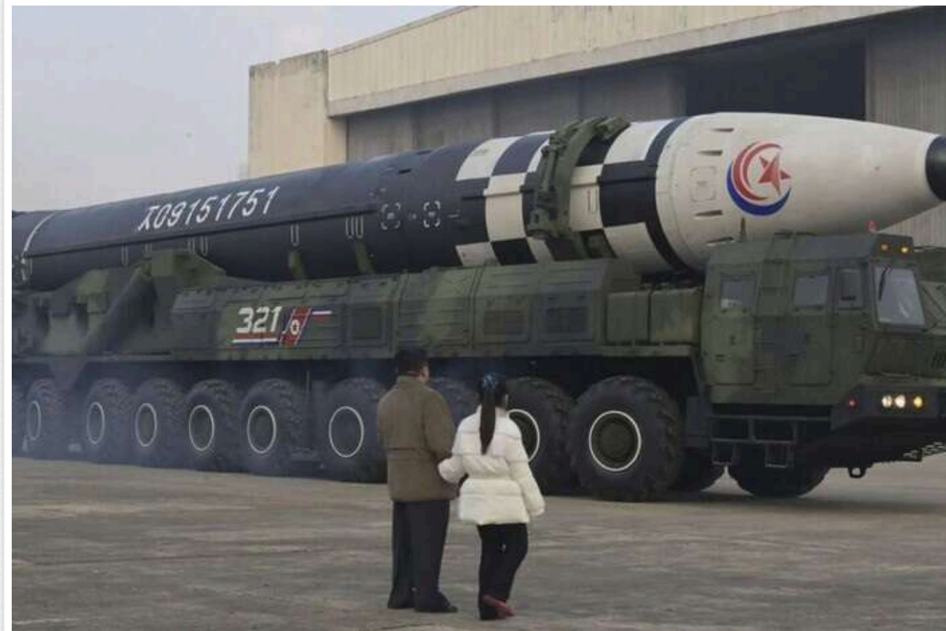
Reuters: Північна Корея нарощує виробництво ракет, якими Росія обстрілює Україну

Американські дослідники, використовуючи супутникові знімки, виявили, що Північна Корея суттєво розширює ключовий завод, який виробляє балістичні ракети, які Росія застосовує у війні проти України.