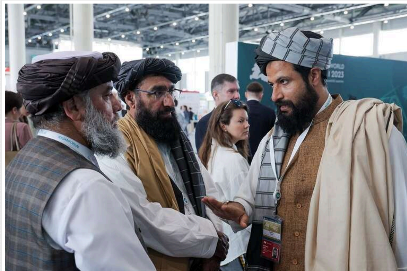
Росіяни зможуть безкарно вступати в «Талібан»