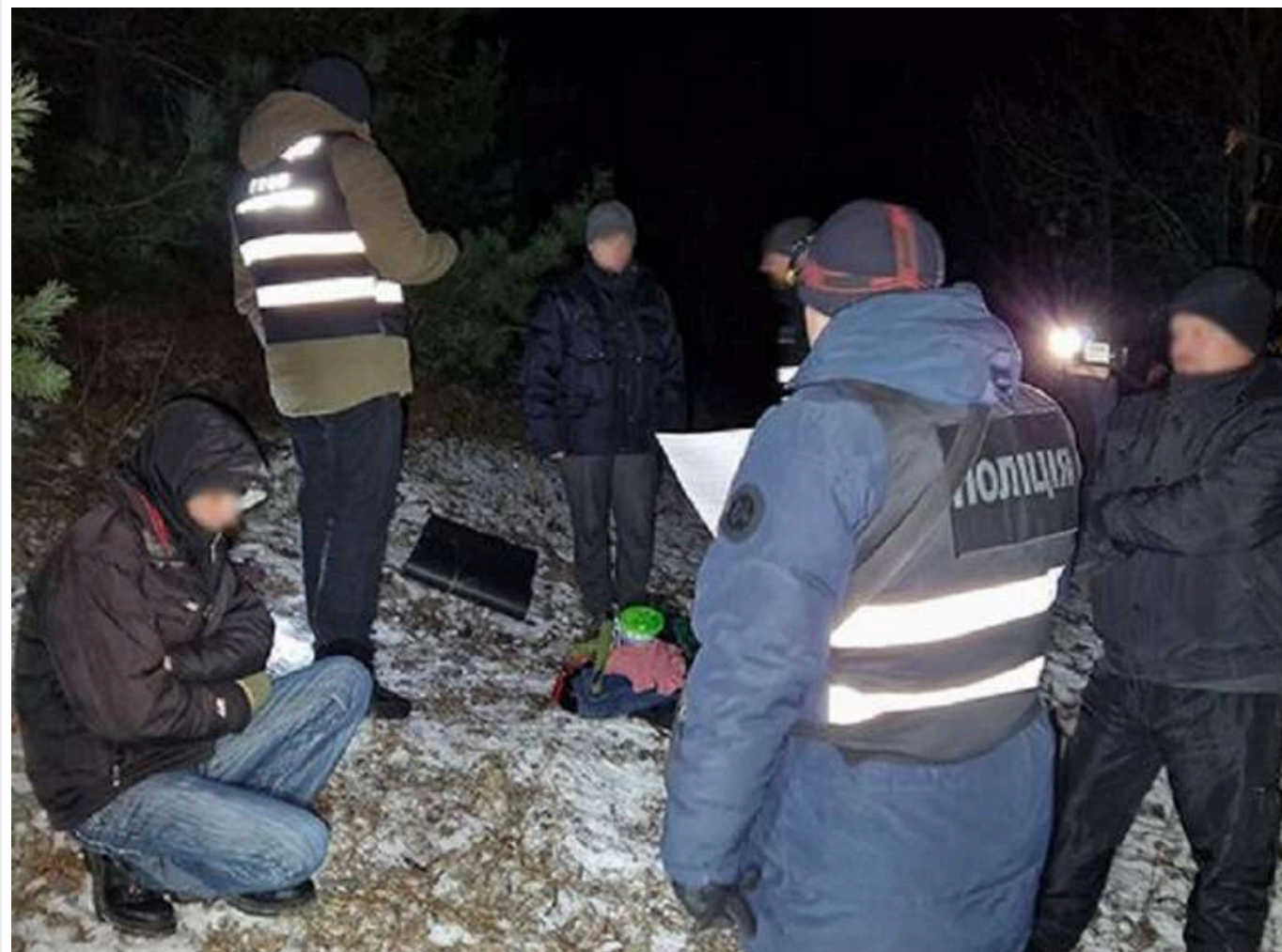
На Чернігівщині затримали підозрюваного в переправленні чоловіків через кордон до Білорусі

На Чернігівщині поліцейські та прикордонники затримали чоловіка, якого підозрюють в організації схеми незаконного переправлення чоловіків призовного віку через державний кордон до Білорусі. Чоловіка затримали на березі Дніпра. На місці події правоохоронці вилучили спорядження: гідрокостюм та ласты.