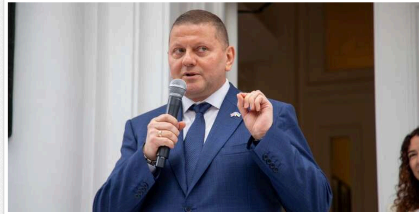
Залужний переможе на виборах президента не залежно від конкурентів, — соцдослідження

У громадян спитали, якиби найближчої неділі відбувалися вибори президента України, за кого б ви проголосували?