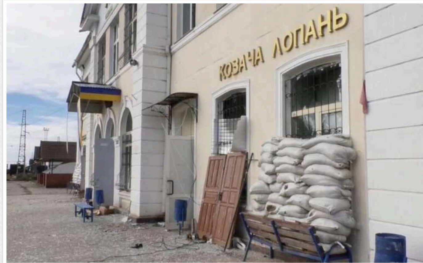
У ЦПД заперечили повідомлення щодо наступу РФ на Козачу Лопань

Українські військові повністю контролюють кордон у Харківській області, наступу армії РФ на Козачу Лопань немає.