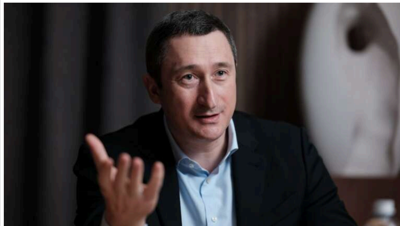
Голова "Нафтогазу" Олексій Чернишов є першим серед кандидатів на посаду посла України в США

Колишній міністр розвитку громад та територій, а нинішній голова НАК "Нафтогаз України" Олексій Чернишов може стати новим послом України в США. Він є першим у списку претендентів на цю посаду.