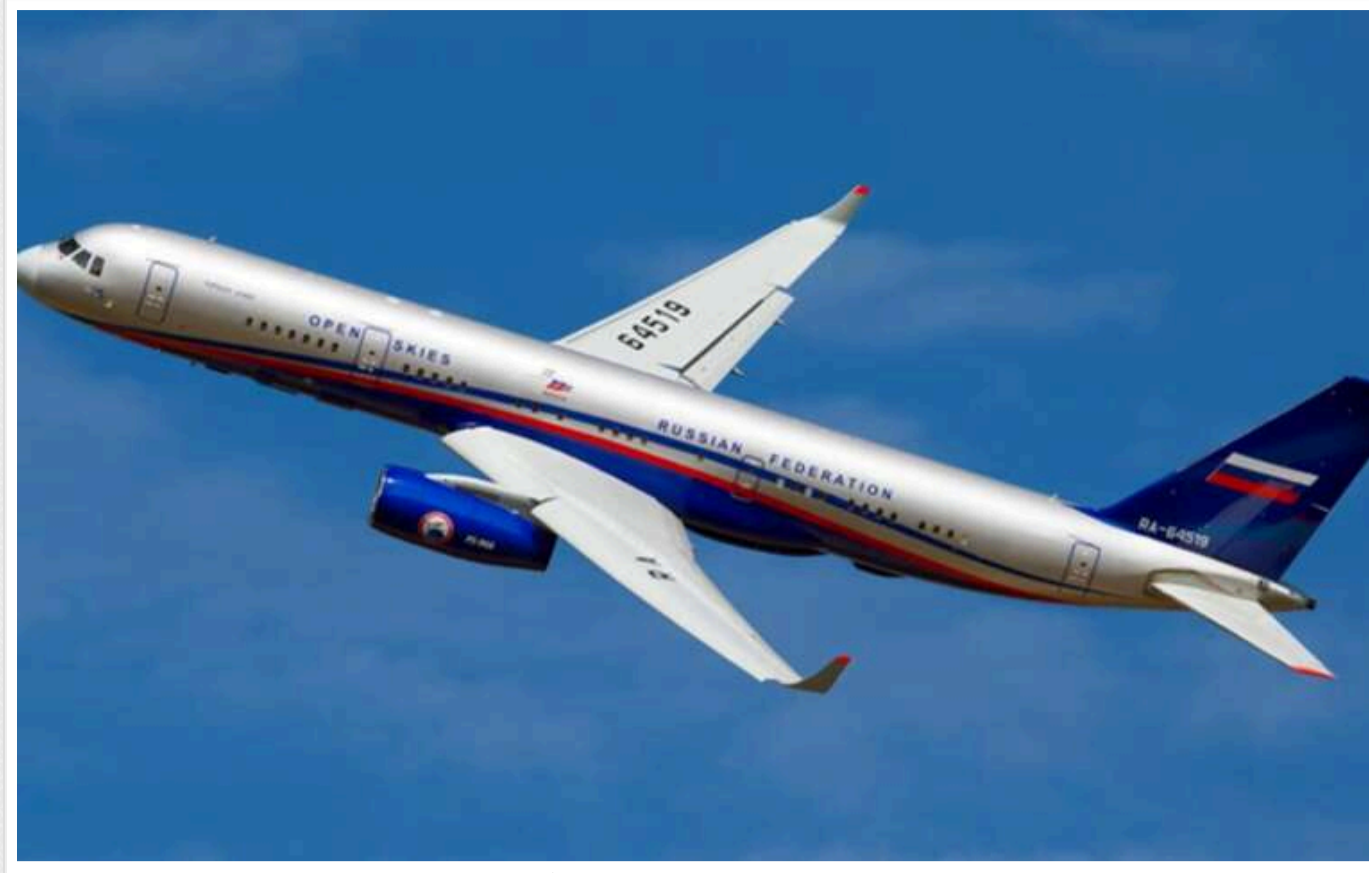
У російській авіагалузі почалися зачистки топменеджерів

Режим кремлівського диктатора Володимира Путіна визнав провал у російській авіабудівній галузі. Щоб збільшити виробництво вітчизняних пасажирських літаків, почалися зміни серед топменеджерів у цій сфері.