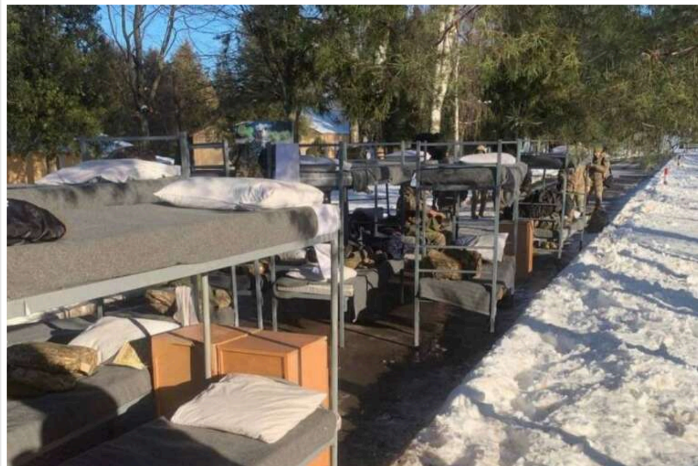
"Пожежа" абсурду: як у прикордонній академії принижують курсантів

Війна триває 11-й рік, а в Національній академії Держприкордонслужби досі практикують застарілі методи «виховання».