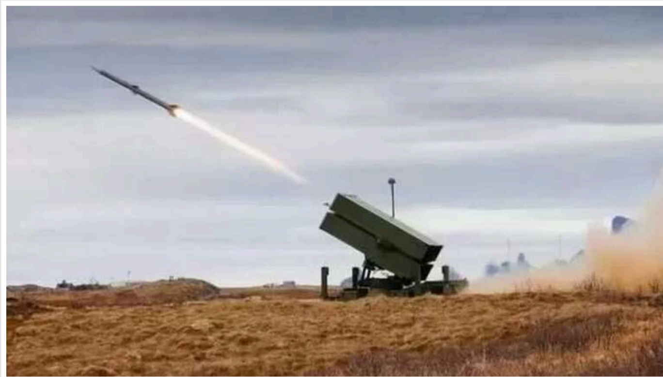
Forbes: Без посилення ППО Україні загрожує втрата західних винищувачів

Як повідомляє Forbes, Росія знищила ще один літак за допомогою розвідувального дрона та ракети "Іскандер".