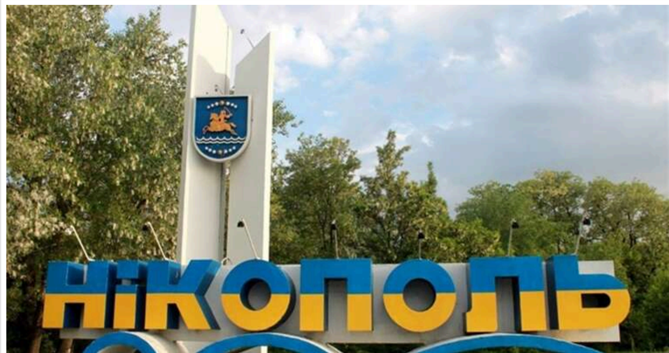
Окупанти вшосте за день обстріляли Нікопольський район: пошкоджено інфраструктуру

Російська армія обстріляла Нікопольський район шість разів протягом дня. У Нікополі пошкоджено інфраструктурний об'єкт.