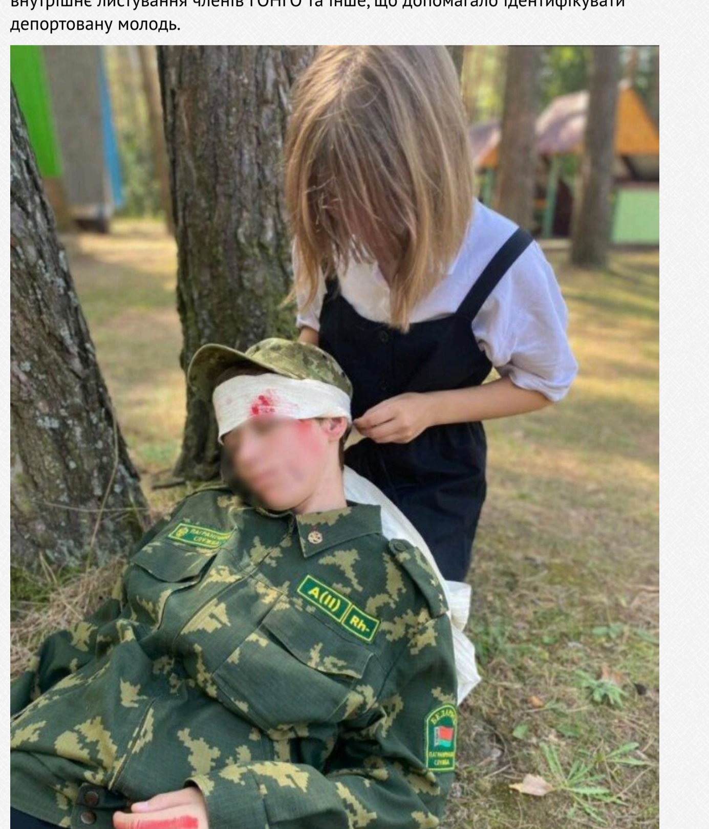
Депортовані діти в одному з військових таборів Білорусі

У 2022–2023 роках БЕЛПОЛ отримував інформацію від контактів в середині Білорусі: проїзні квитки, імена дітей з окупованих українських територій, їхні особисті дані, внутрішнє листування членів ГОНГО та інше, що допомагало ідентифікувати депортовану молодь.