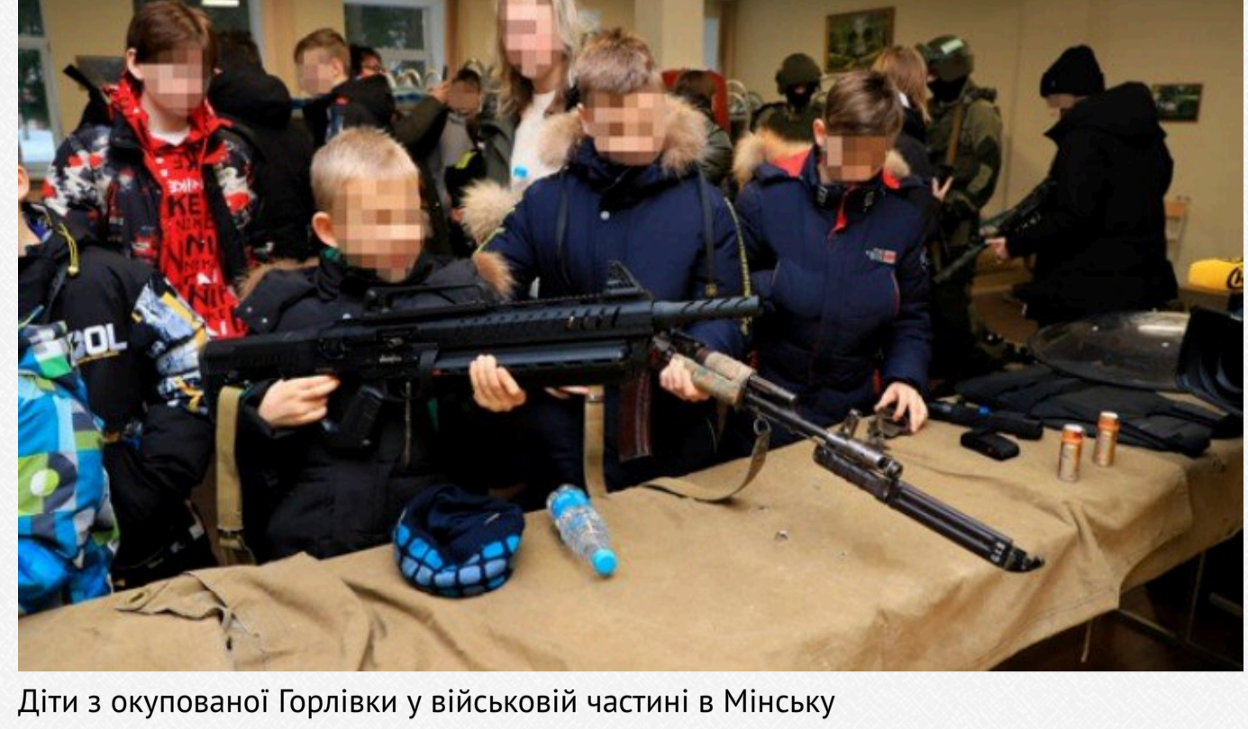
Діти з окупованої Гортливи у військовій частині в Мінську

Від початку великої війни російські загарбники масово вивозять українських дітей з окупованих ними територій до РФ. Проте вони це роблять не самі. Їм допомагає сусідня Білорусь, на що цивілізований світ звертає менше уваги. Білоруський режим цілковито підтримує російську державну політику. Тому везе дітей і на свою територію, перевиховує їх та мілітаризує.