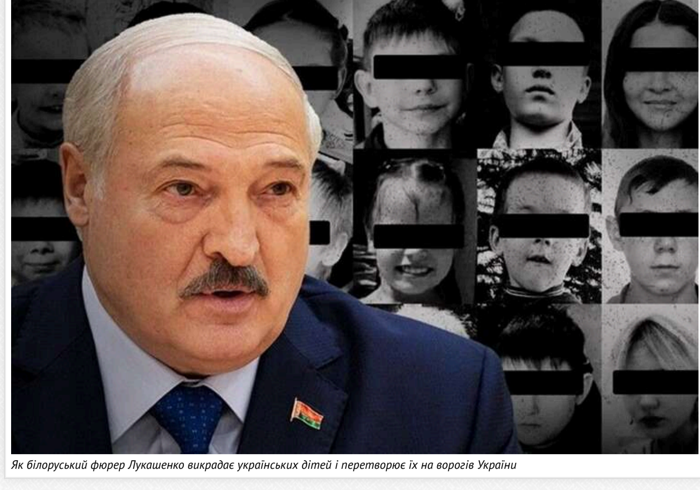
Як білоруський фюрер Лукашенко викрадає українських дітей і перетворює їх на ворогів України

З 2021 року вдалося ідентифікувати 2219 українських дітей, яких перемістили до Білорусі з окупованих територій. Туди везуть переважно мешканців інтернатув бучицтво на оздоровлення.