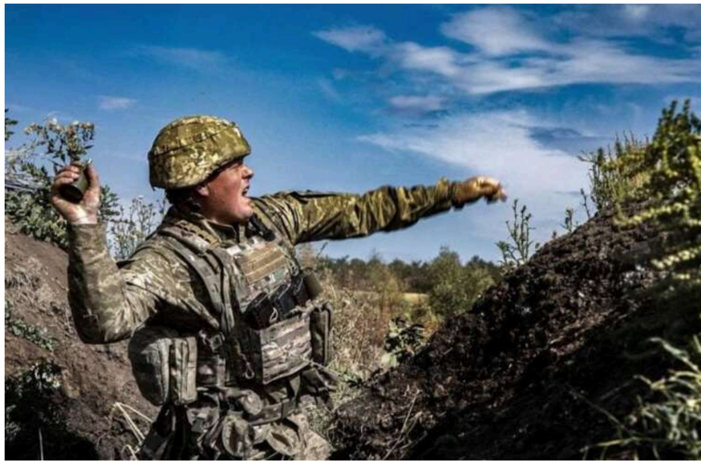
Український військовий самотужки зупинив штурм групи російських загарбників

Українські воїни, що захищають свою землю від російських окупантів, демонструють на полі бою надзвичайну відвагу та героїзм. У мережі з'явилося відео бою, де один з бійців 54 окремої механізованої бригади самотужки зупинив атаку російської штурмової групи з шести загарбників.