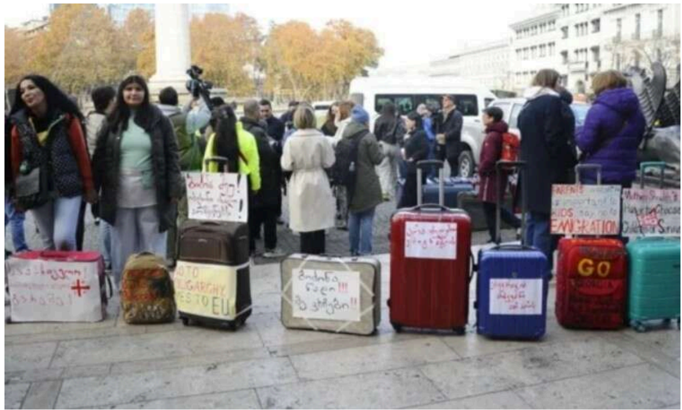
У Грузії протестувальники принесли валізи до дому засновника правлячої партії

Учасниці жіночого маршу принесли валізи до резиденції засновника та почесного голови партії влади Грузії "Грузинська мрія" Бідзіни Іванішвілі.