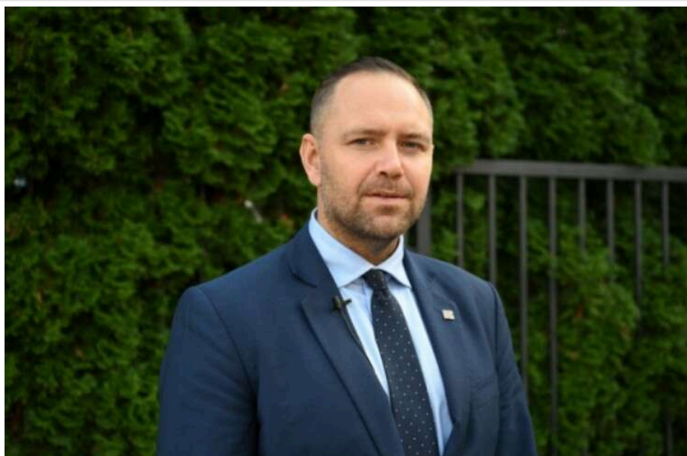
"Право і справедливість" підтримує керівника Інституту національної пам'яті як кандидата на посаду президента Польщі

Кароль Навроцький, керівник Інституту національної пам'яті Польщі, буде кандидатом у президенти на виборах наступного року, а головна опозиційна партія "Право і справедливість" його підтримає.